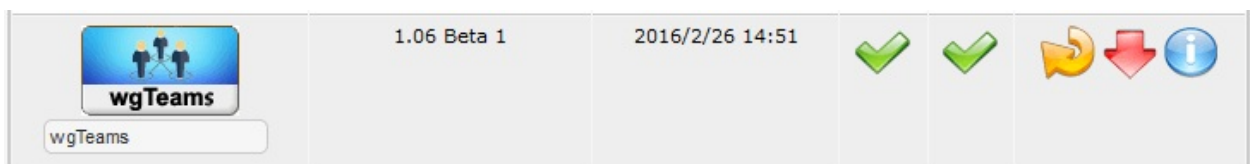
Abbildung 3 Deinstallation in der Moduladministration

Zur Deinstallation klicken sie einfach auf den roten Pfeil