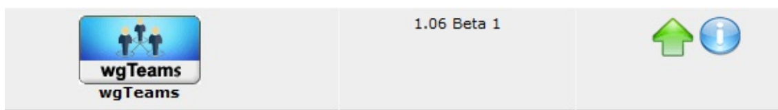
Abbildung 2 Die Moduladministration und Installation