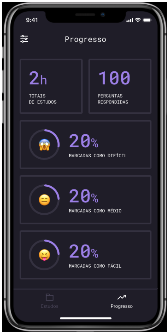
Tela de Progresso